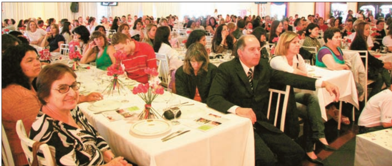
Cerca de 800 pessoas participaram do evento de premiação

“O Agrinho é uma união de esforços que resulta em notável avanço na formação da cidadania” - Ágide Meneguette